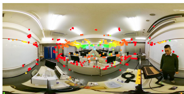
図2 教室（屋内）での深度マップ生成例

(1) 池田輝政、遠藤正隆、中嶋裕一、松井瑠偉人、菱田隆彰、“全天球カメラによる深度マップ作成手法の検討”、情報処理学会第84回全国大会発表論文集、vol.2、pp.67-68、2022年